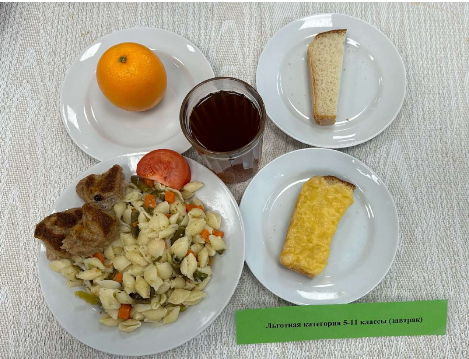
Льготная категория 5-11 классы (завтрак)