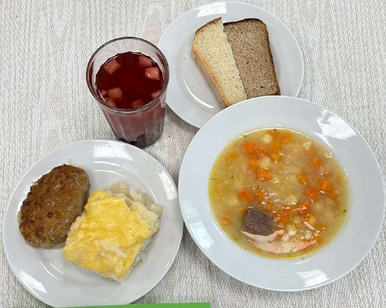
Льготная категория 5-11 классы (обед)