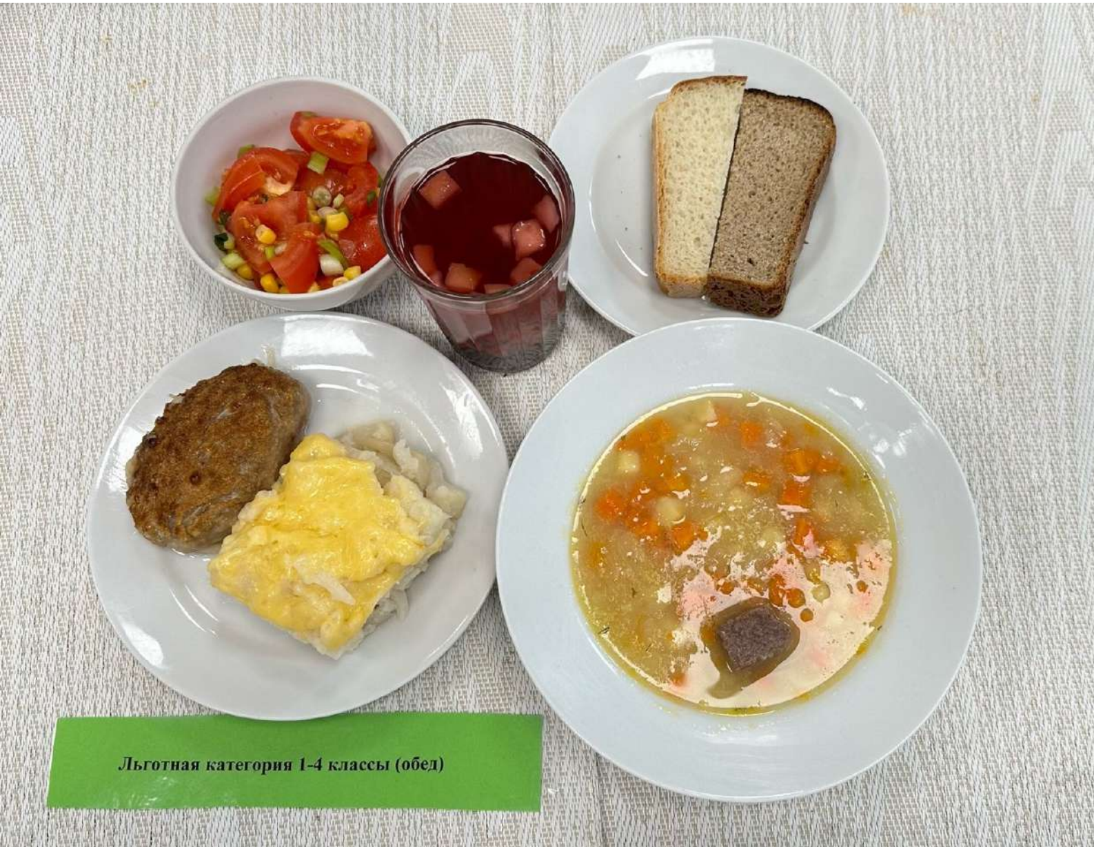
Льготная категория 1-4 классы (обед)