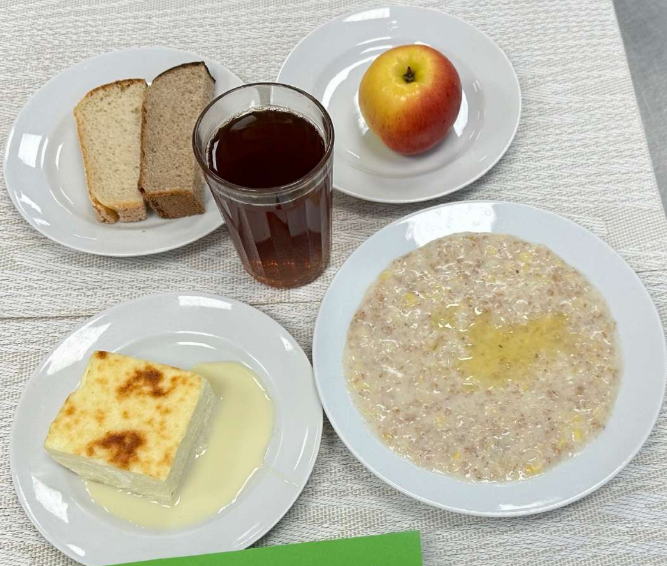
Льготная категория 5-11 классы (завтрак)