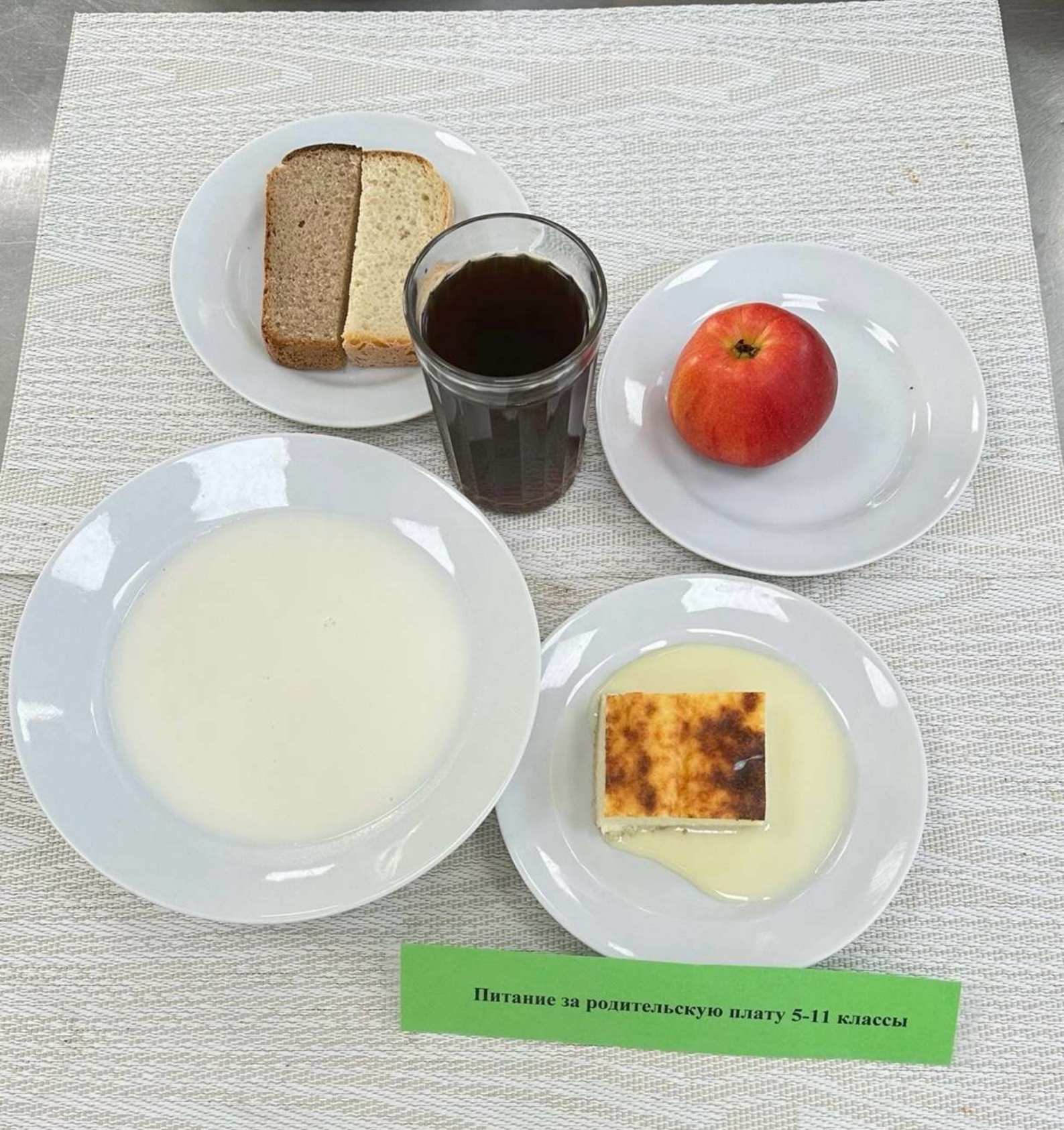
Питание за родительскую плату 5-11 классы