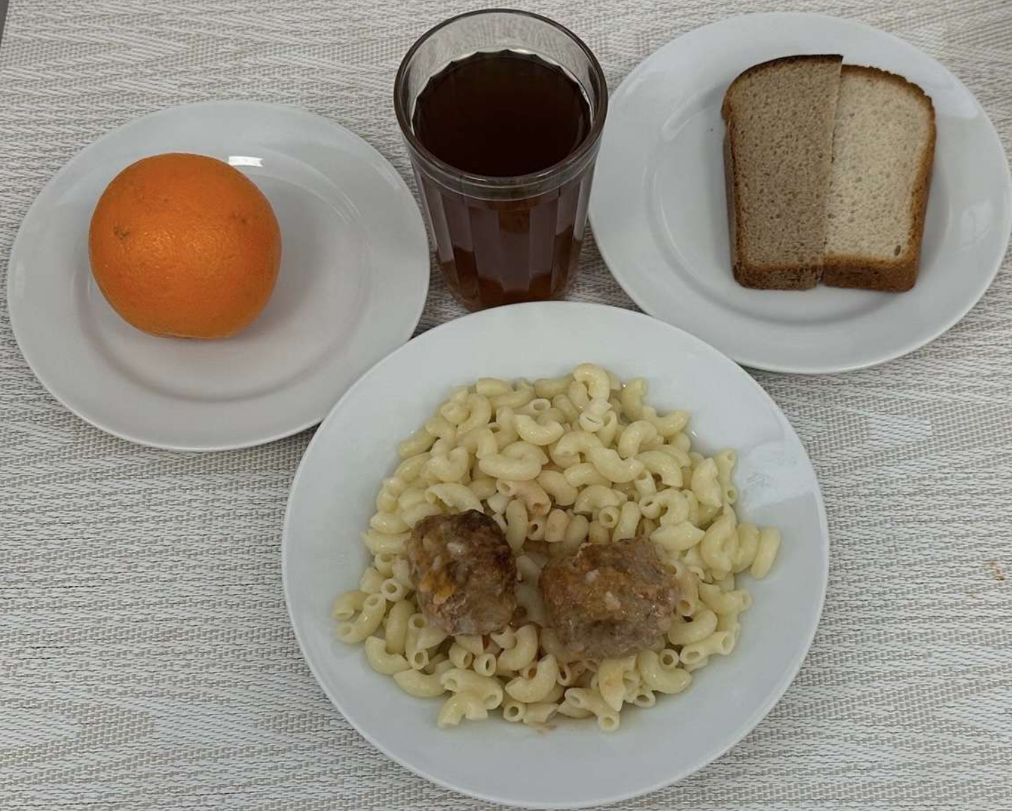
Льготное питание II смена (12 лет и старше)-Полдник