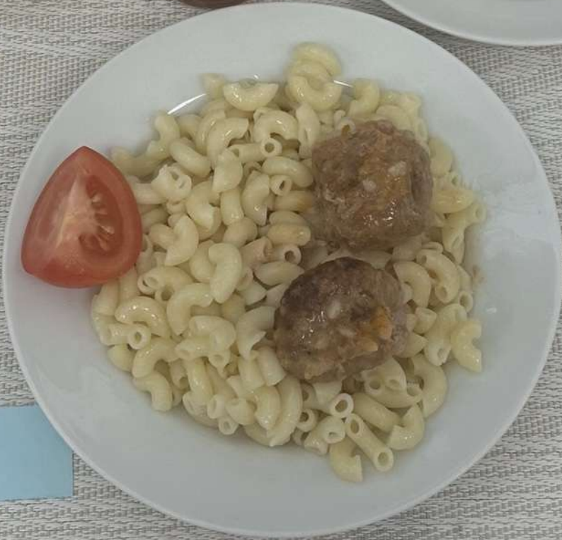
Завтрак (7 - 11 лет)