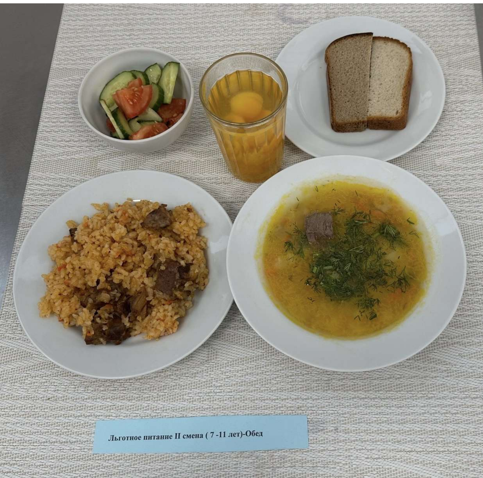
Льготное питание II смена (7-11 лет)-Обед