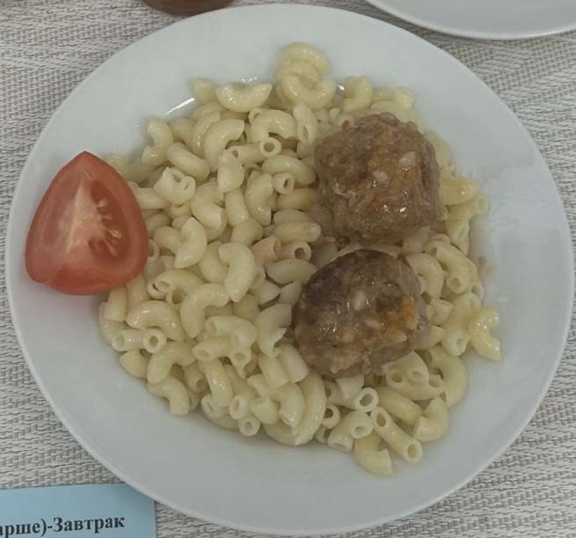
Льготное питание I смена ( 12 лет и старше)-Завтрак