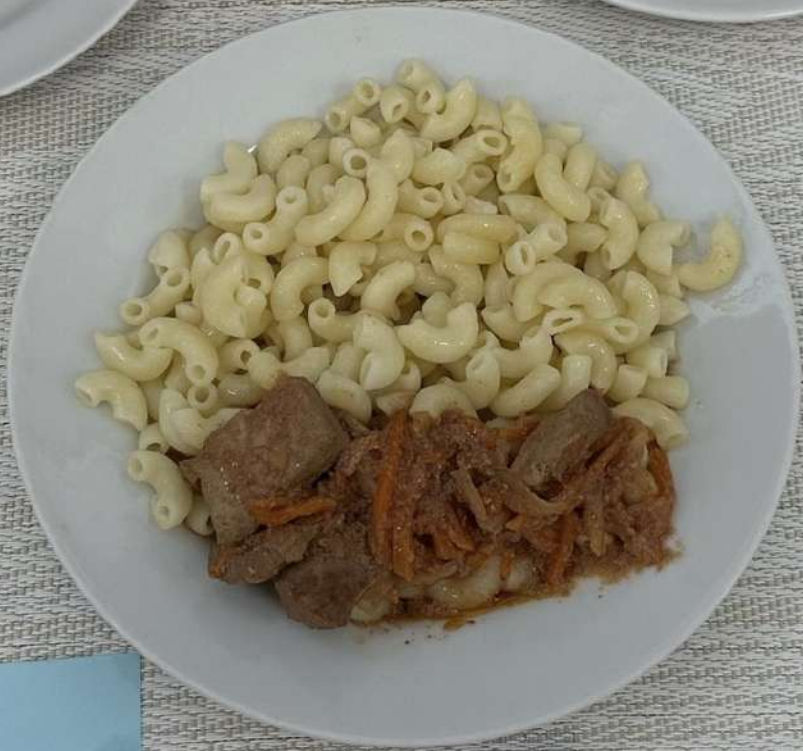
Завтрак (12 лет и старше)