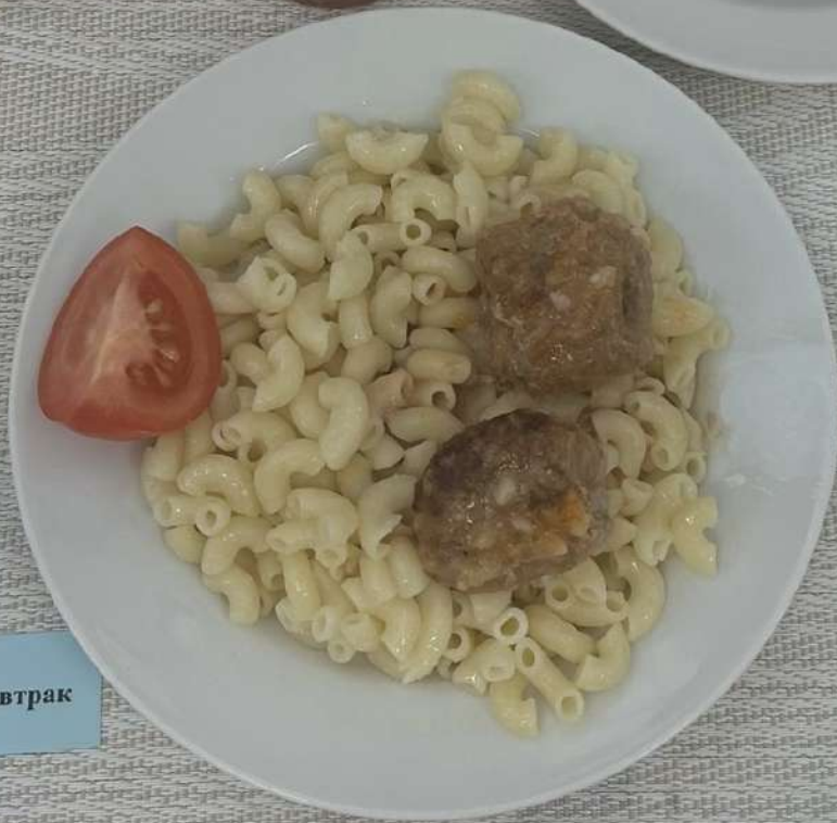
Льготное питание I смена (7-11 лет)-Завтрак