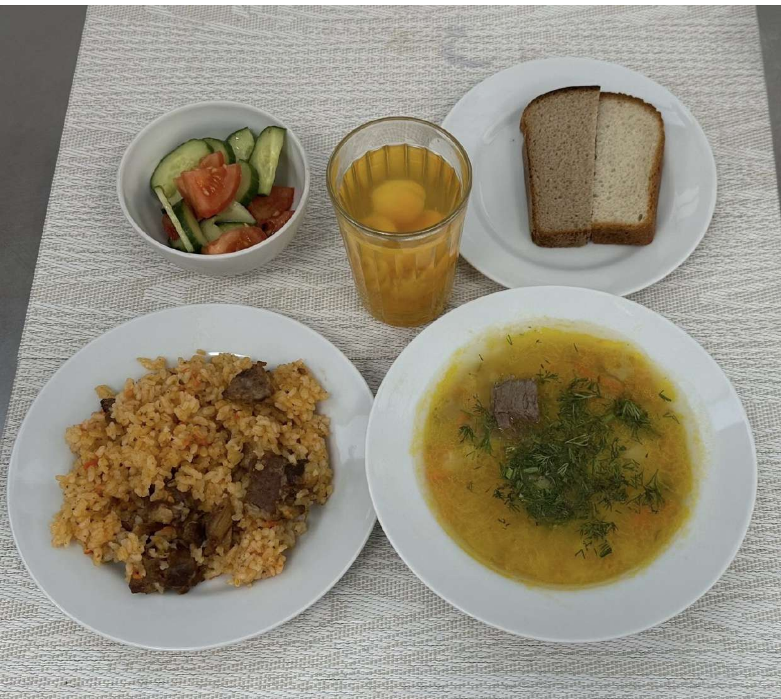
Льготное питание II смена (12 лет и старше)-Обед