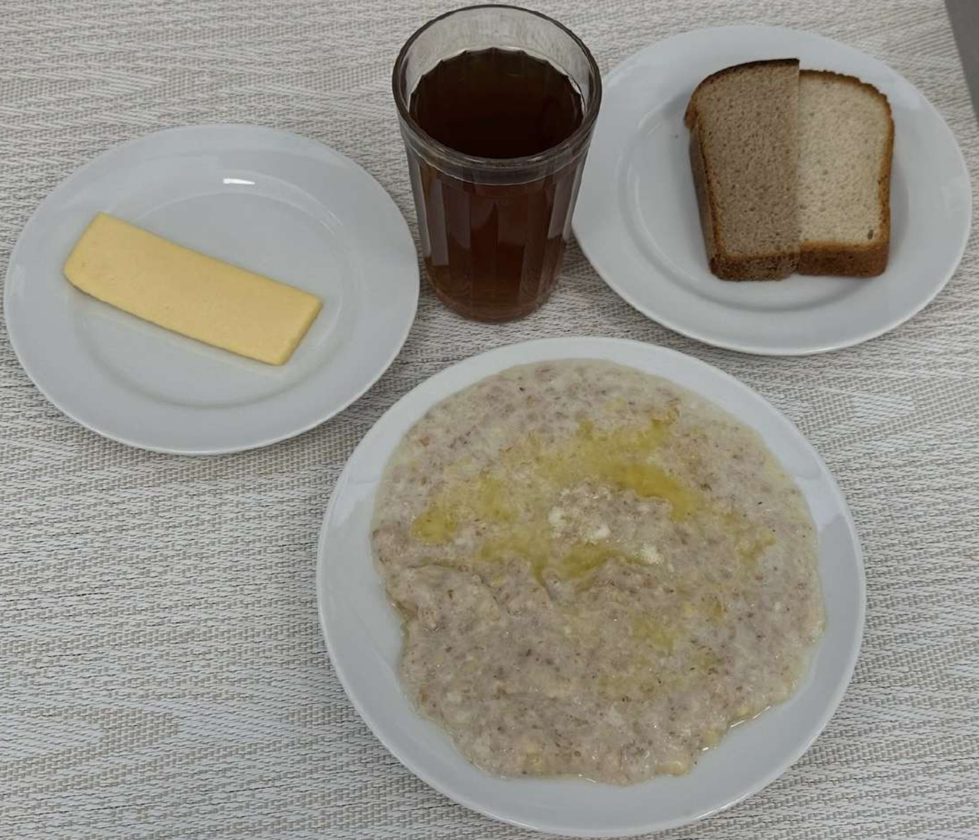
Бесплатное питание (12 лет и старше)