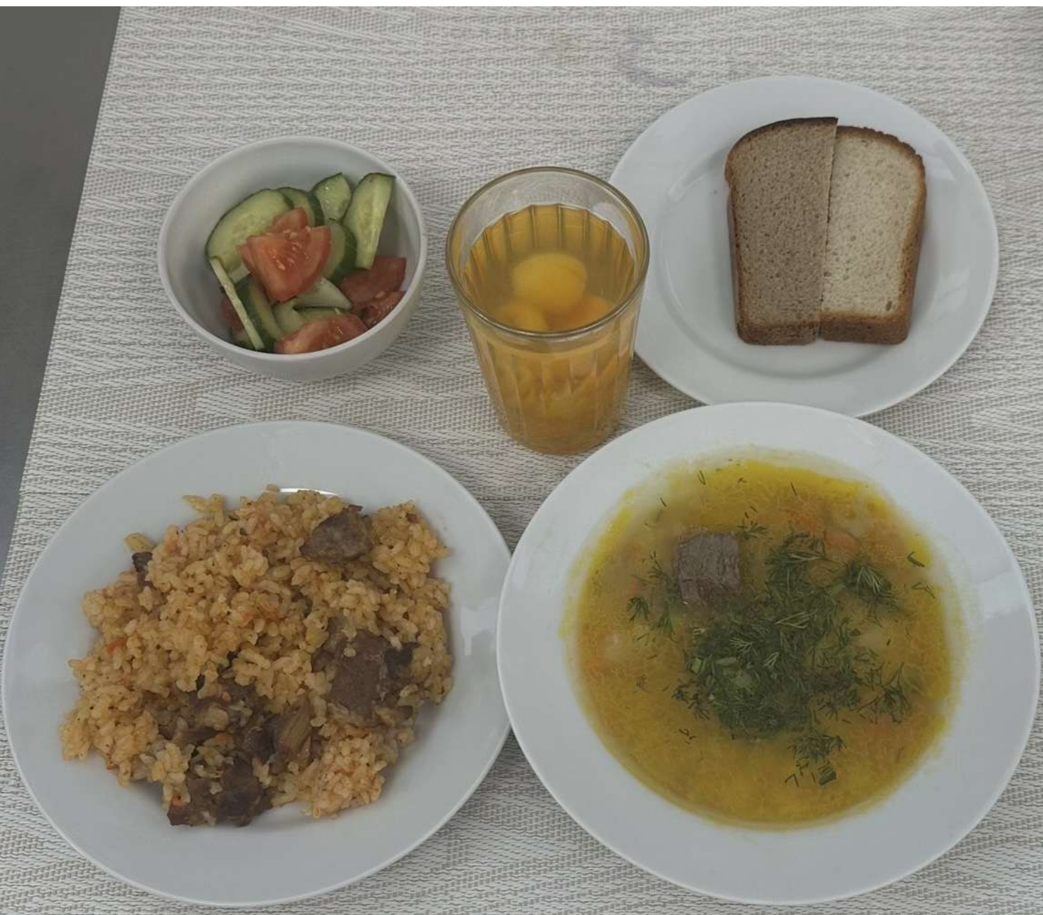
Льготное питание I смена (7-11 лет)-Обед