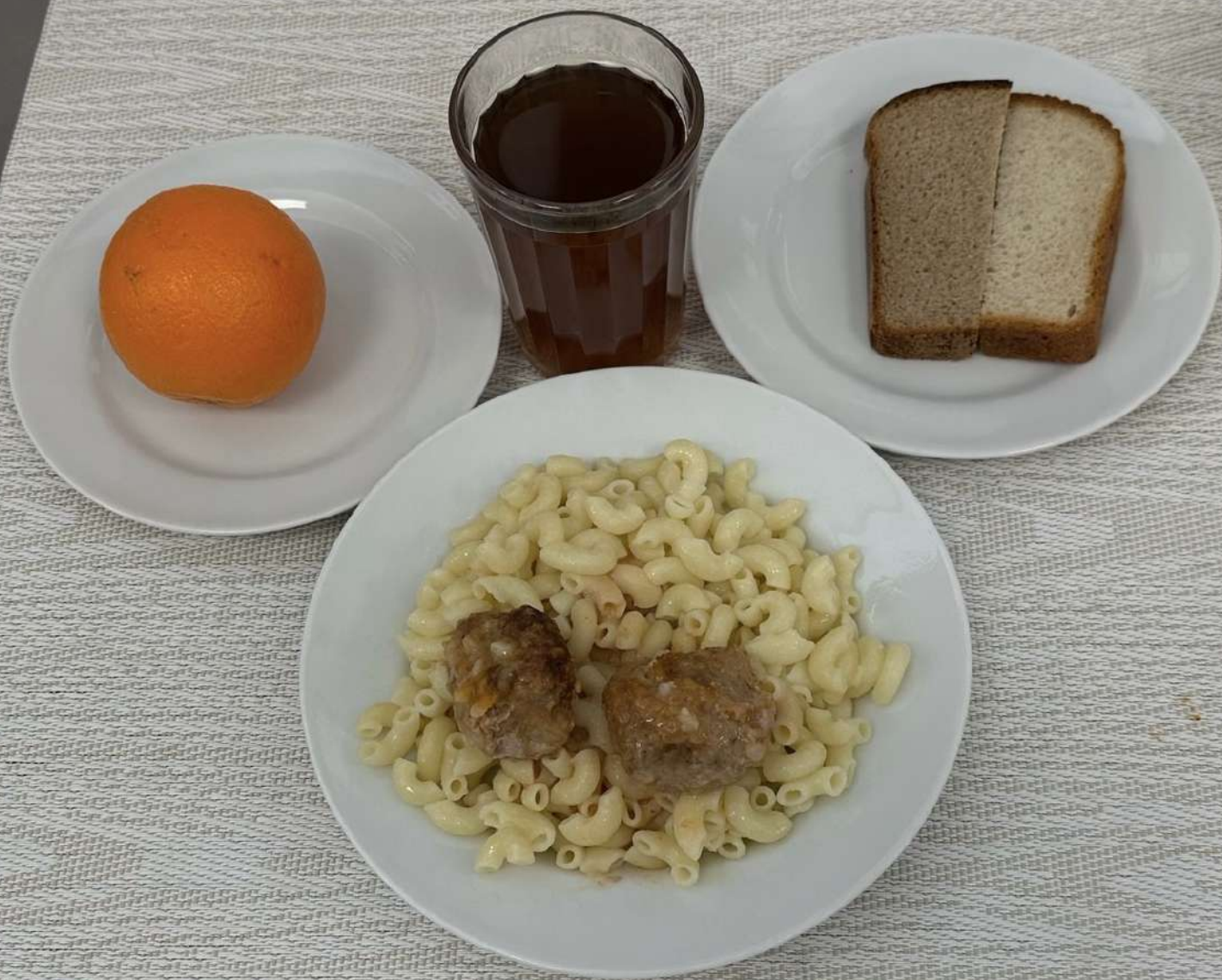
Льготное питание II смена (7-11 лет)-Полдник