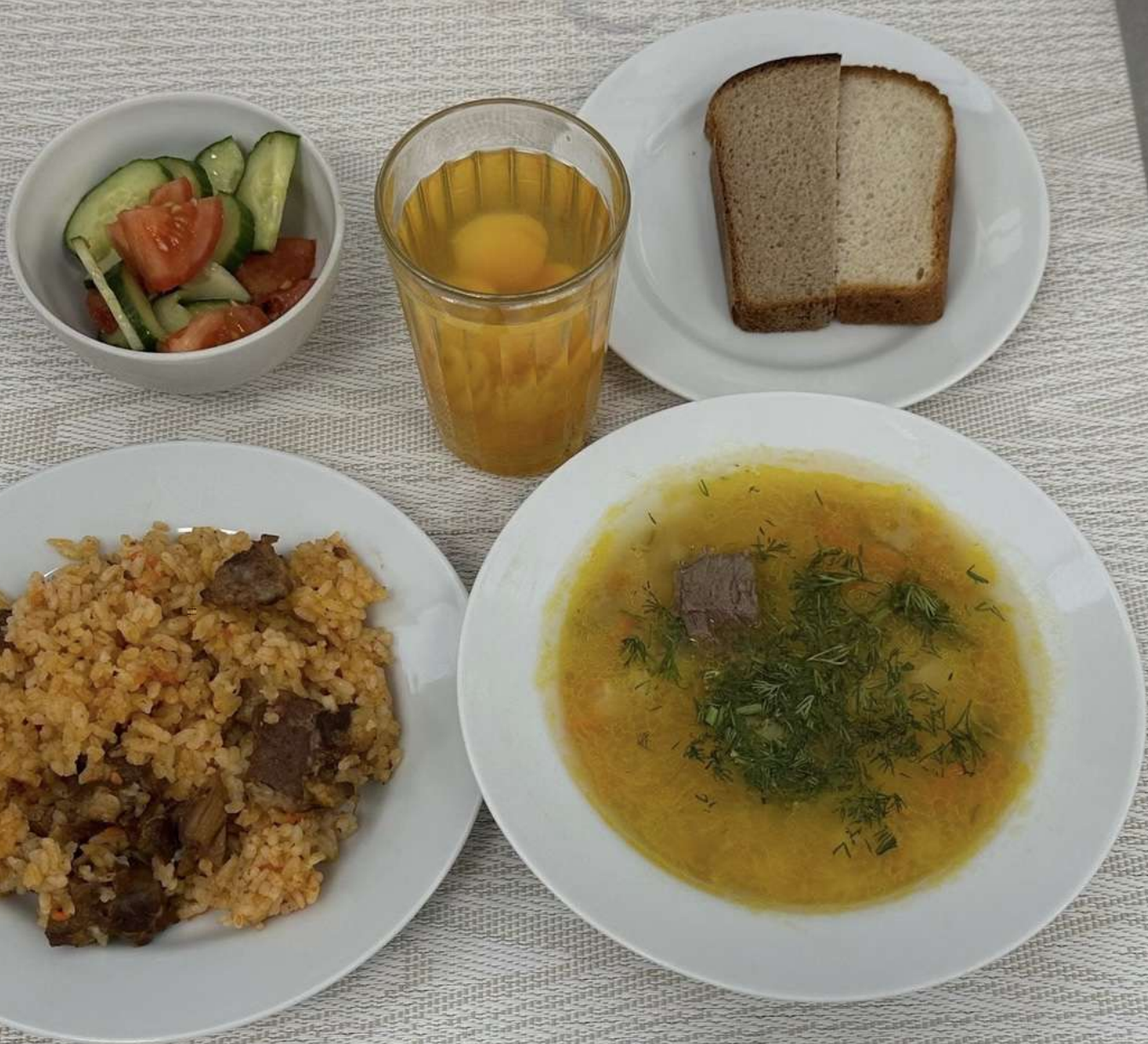
Льготное питание I смена (12 лет и старше)-Обед