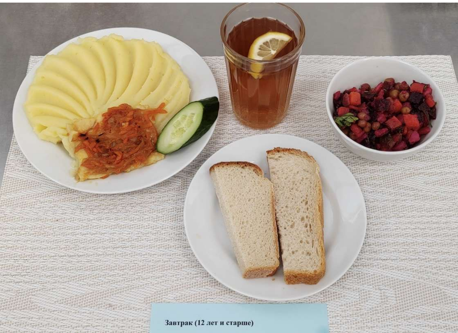
Завтрак (12 лет и старше)