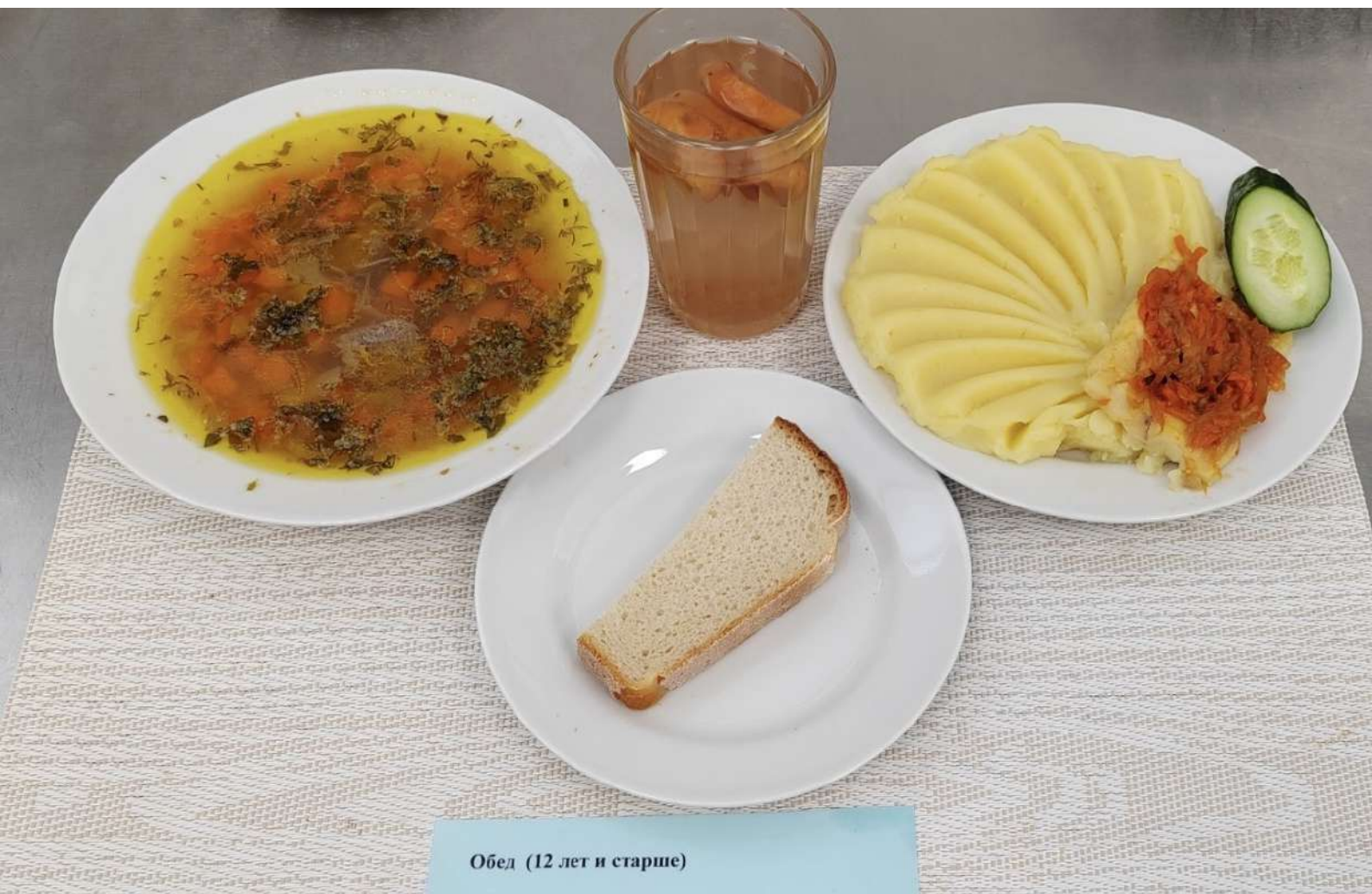
Обед (12 лет и старше)