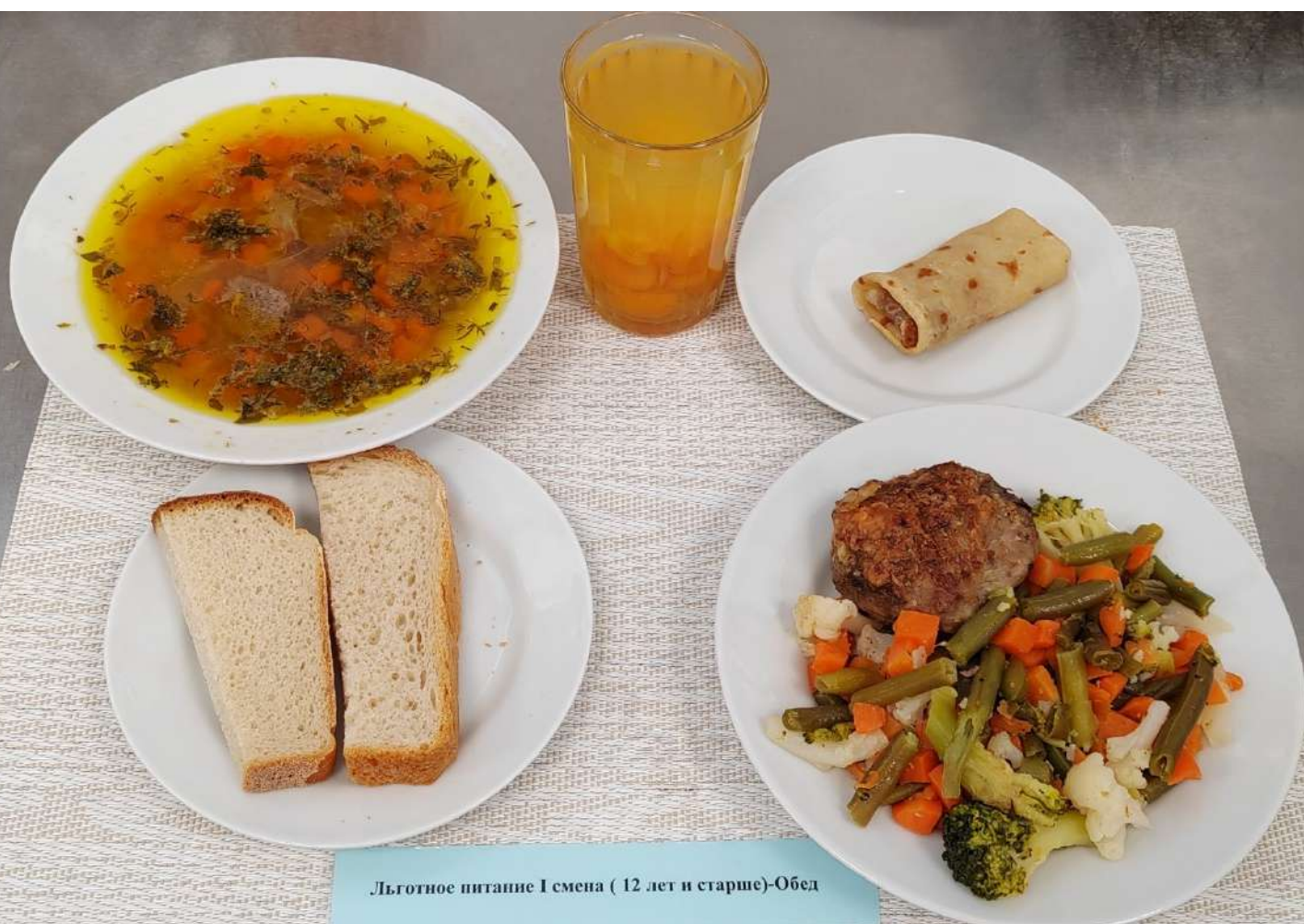
Льготное питание I смена ( 12 лет и старше)-Обед