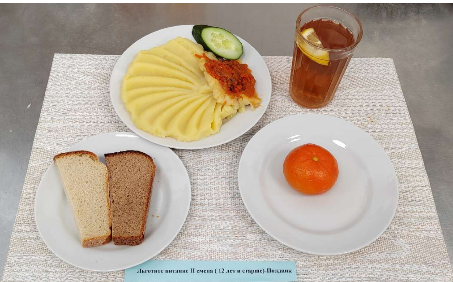
Льготное питание II смена ( 12 лет и старше)-Полдник