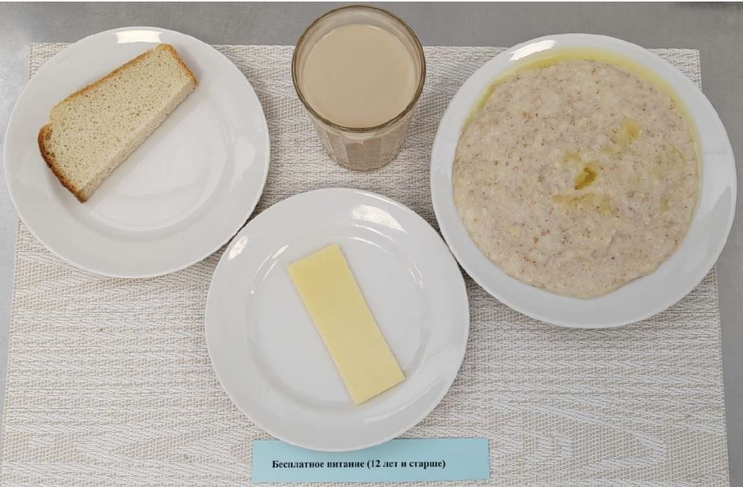
Бесплатное питание (12 лет и старше)