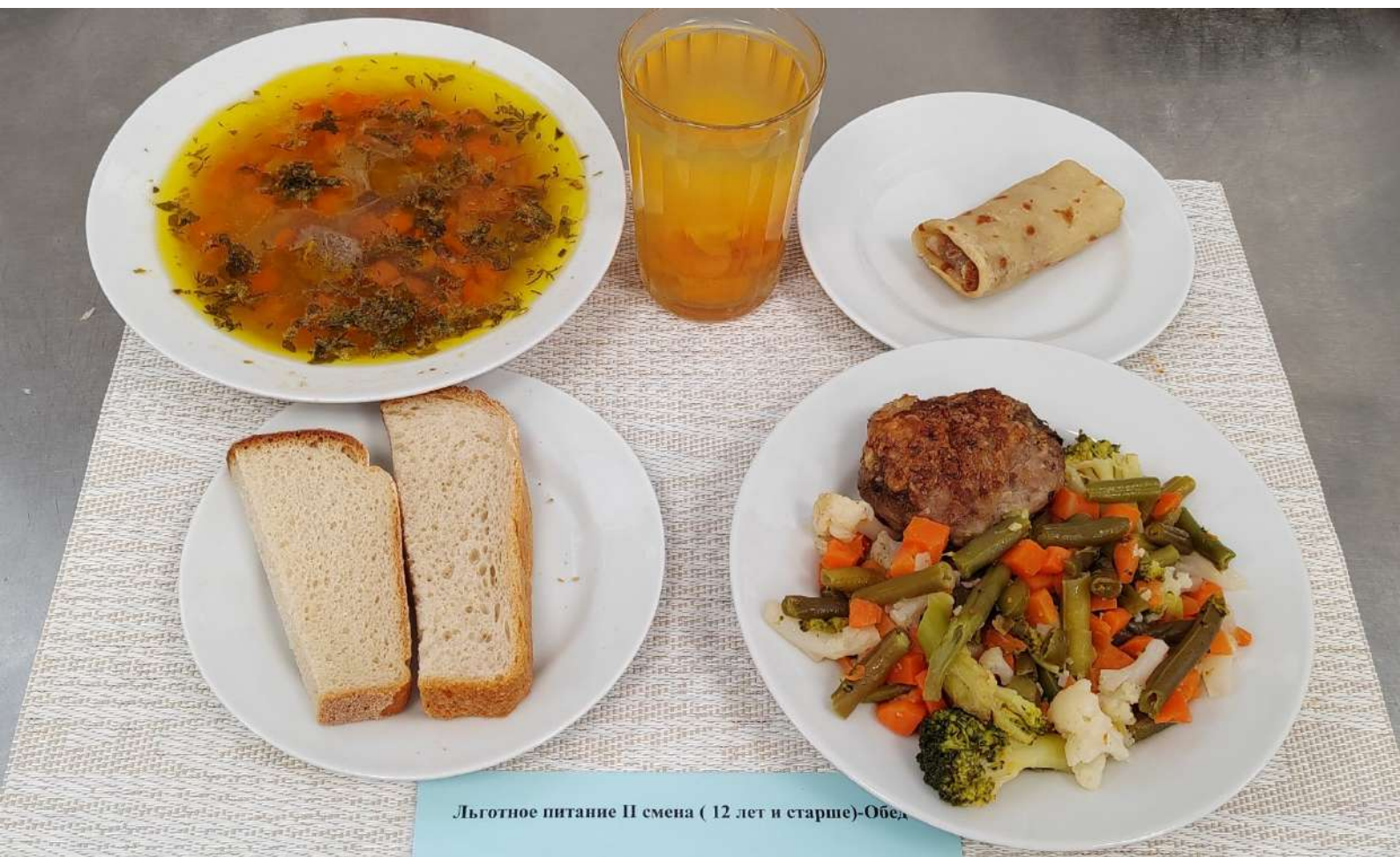
Льготное питание II смена ( 12 лет и старше)-Обед