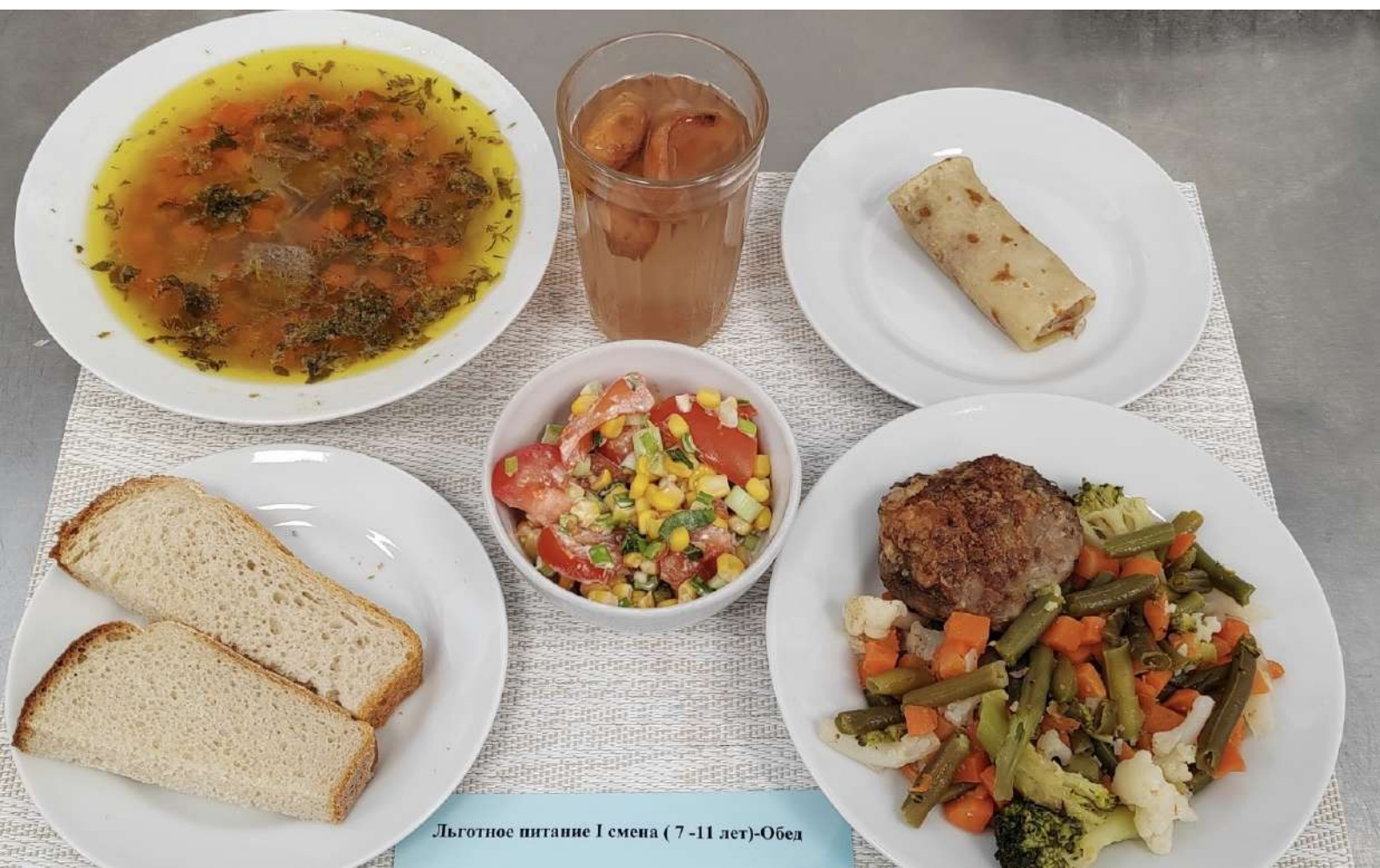
Льготное питание I смена (7-11 лет)-Обед