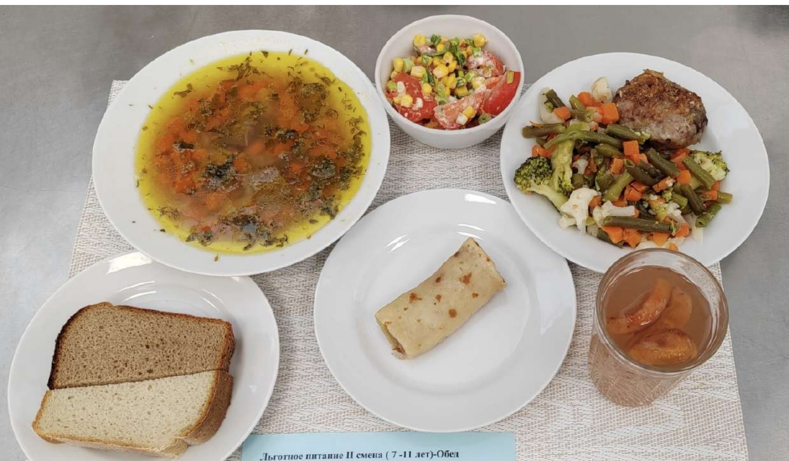
Льготное питание II смена (7-11 лет)-Обед