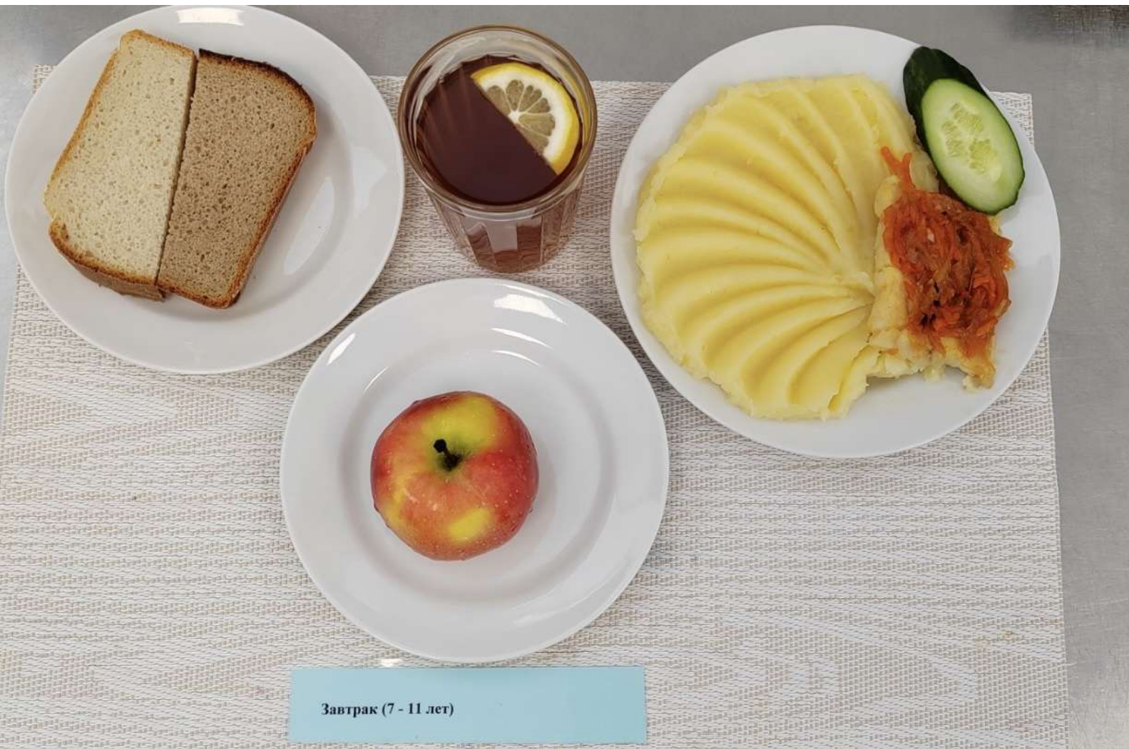
Завтрак (7 - 11 лет)