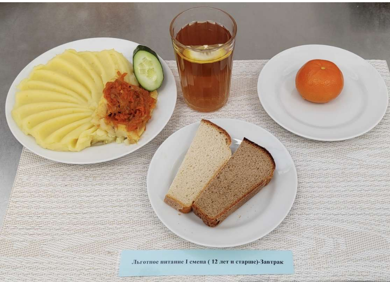
Льготное питание I смена ( 12 лет и старше)-Завтрак